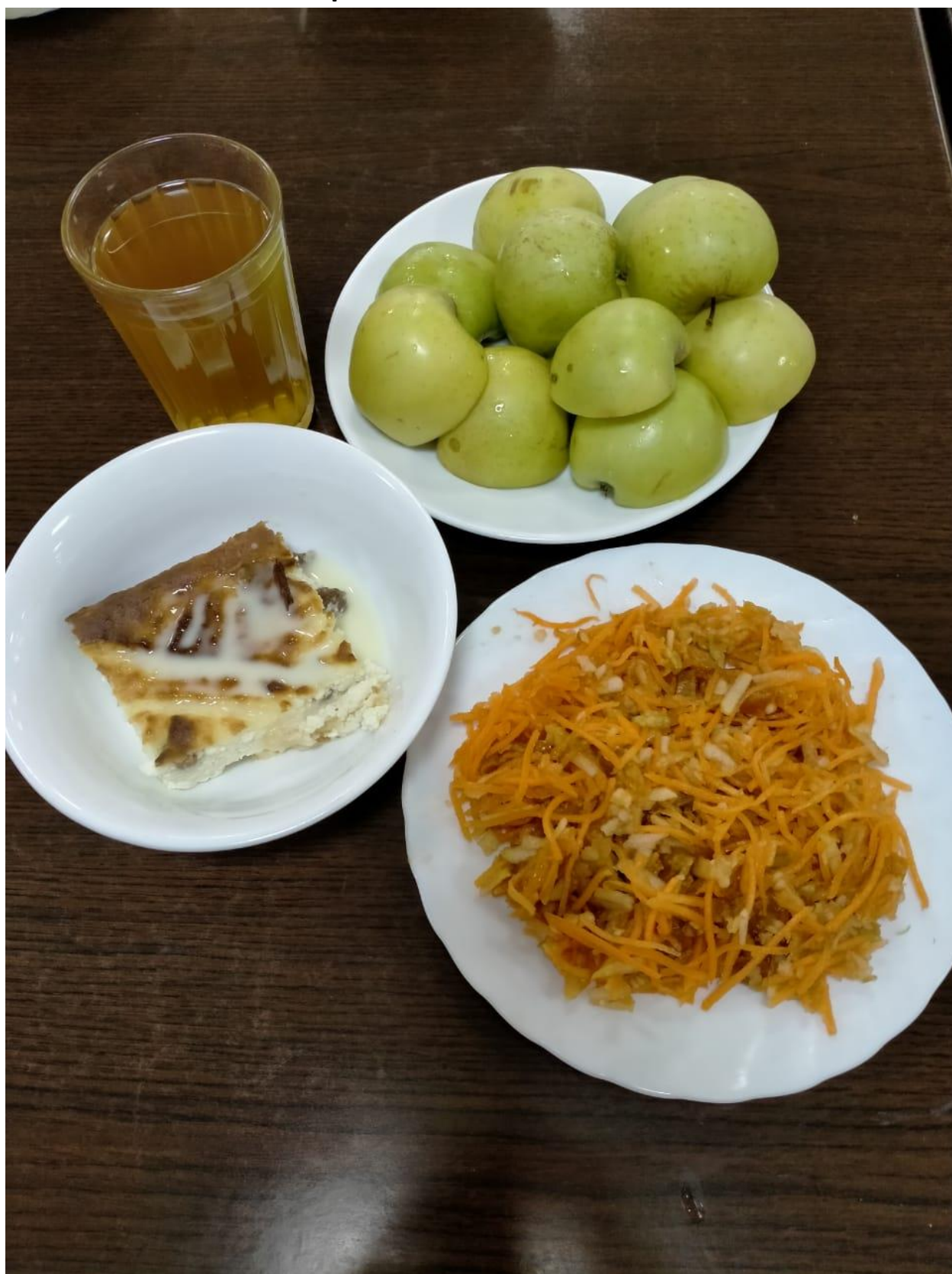
Завтрак 1-4 классы 05.03.2021